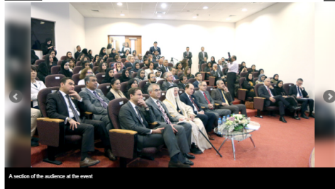
A section of the audience at the event

Bahrain News | 1965, 30 Jan 2019 | By Raji Unnikrishnan