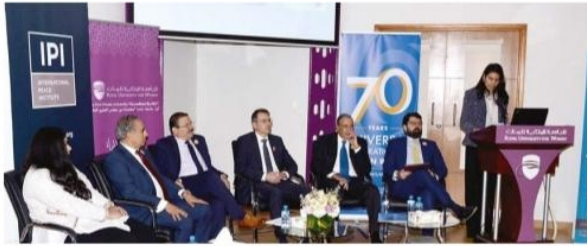
المحتفلون في الاحتفالية