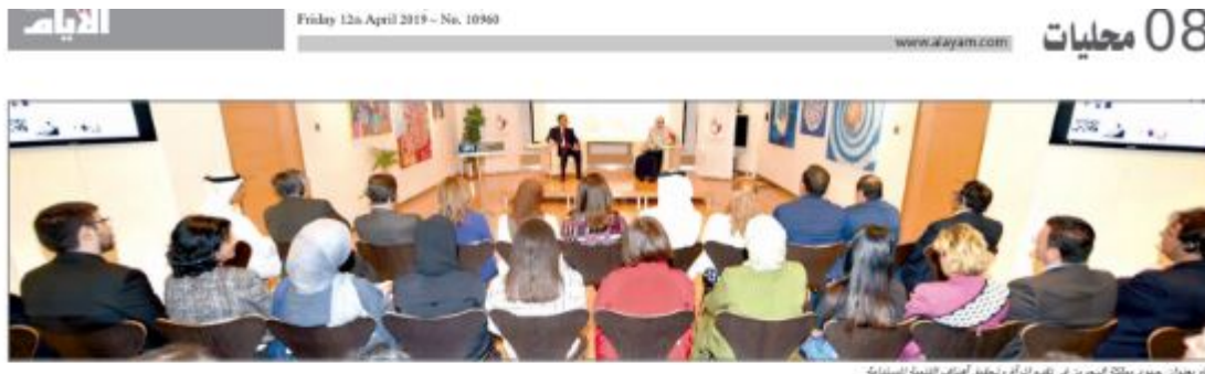
لقاء بعنوان جهود دولة البحرين في تقديم المرأة وتحقيق أهداف التنمية المستدامة